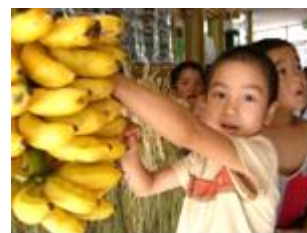
黄色くなって食べごろだ！