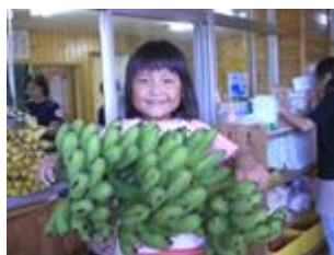
緑色のバナナが送ってきたよ！