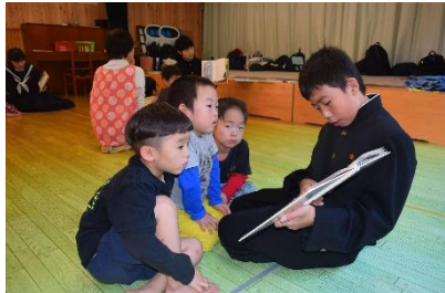
中学生も遊びに来るよ！