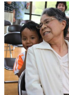
高齢者との交流会で肩たたき