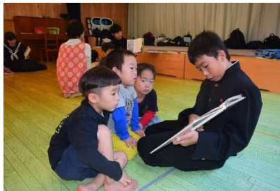
中学生も遊びに来るよ！