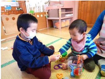
チビ先生「はい、どうぞ」