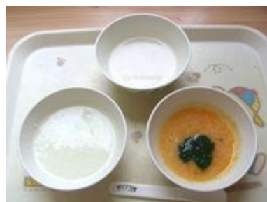
一人ひとりの月齢に併せた離乳食