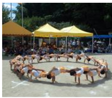
運動会での組体操