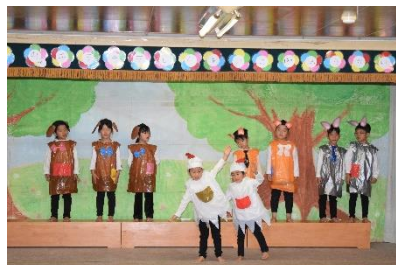
キラキラしんあいっこ発表会