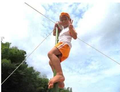
無限の可能性に向かって（登り棒）

□ 戸外散歩や山登り、体育遊びや運動会を通して、身体を動かす楽しみを感じる体験を行います。