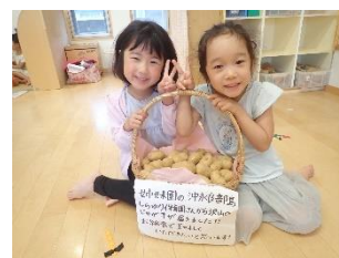
ジャガイモ沢山もらったよ！