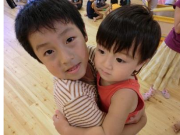
赤ちゃん可愛いなあ！