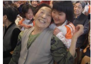
高齢者との交流会で肩たたき