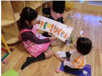
チビ先生“絵本の読み聞かせ”