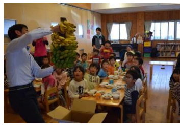
バナナが送ってきたよ！