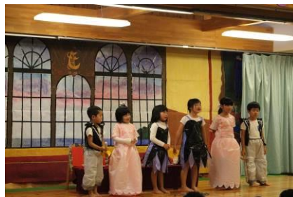
キラキラいろどり発表会