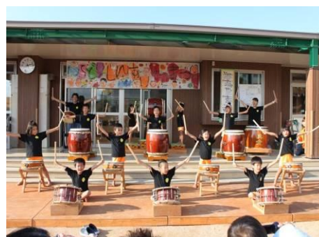
夏祭りでの和太鼓演奏