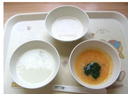
一人ひとりの月齢に併せた離乳食