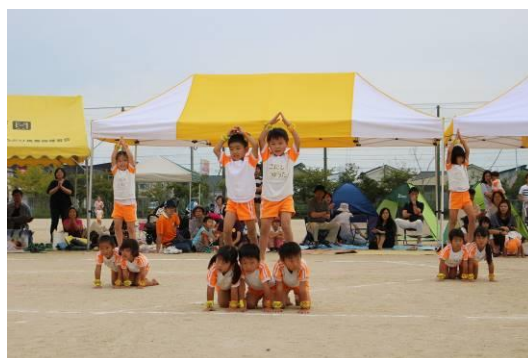
運動会での組体操