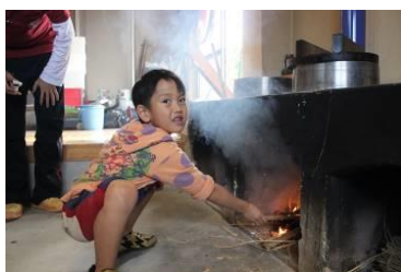
かまどで御飯を炊いたよ！