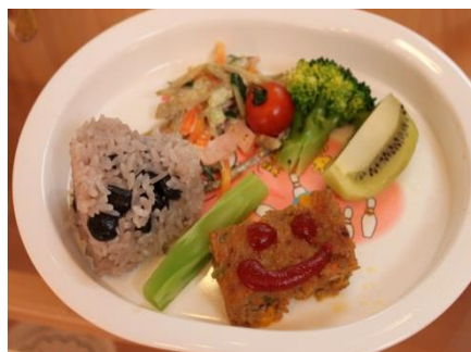
お楽しみ会のしんあいランチ