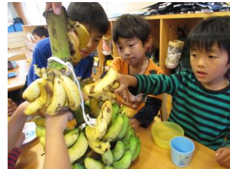
黄色くなって食べごろだ！