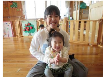
小学生も遊びに来るよ！